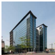
NORTH LIGHT BRUSSEL