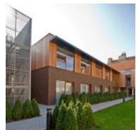
WZC O.L.V. VAN TROOST WESTKAPPELE