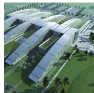
NAVO HQ EVERE