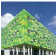
INFRA WEST TORHOUT