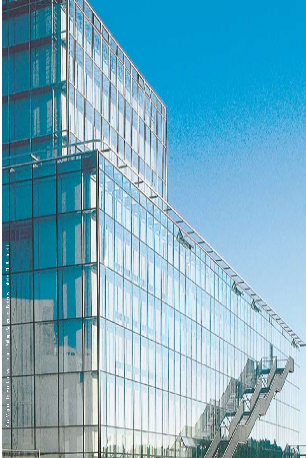
Aula Magna - Louvain-la-neuve - projet : Philippe Samyn and Partners - photo : Ch. Bastin et J.

Sponsorisez et participez à l'événement clé de la construction en acier en Belgique