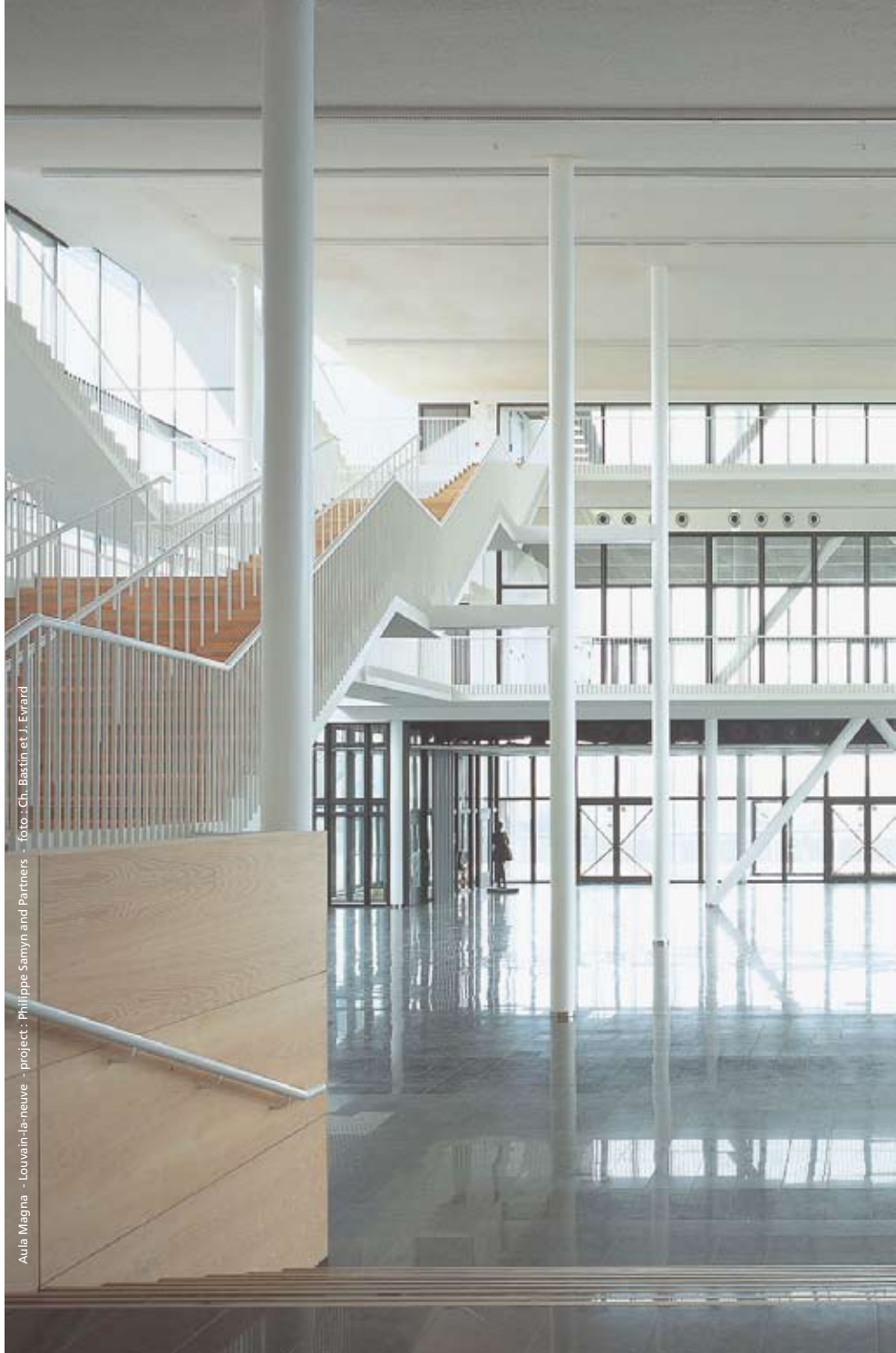
Aula Magna - Louvain-la-neuve - project: Philippe Samyn and Partners

Sponsor en neem deel aan het topevenement voor de staalbouw in België