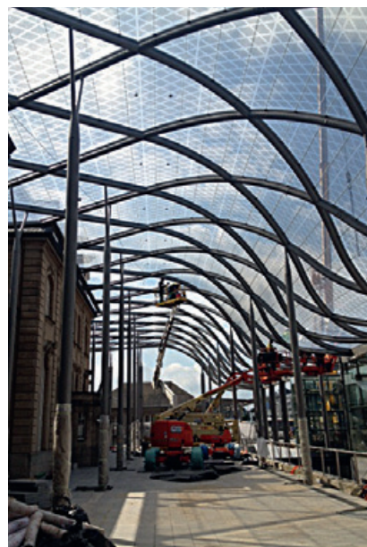
Gare de Luxembourg