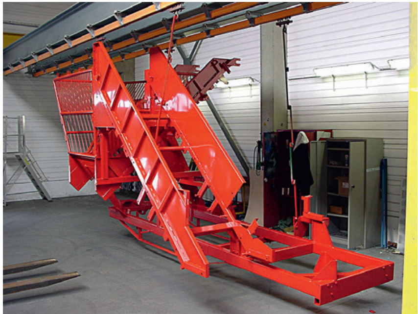
Chargeuse à betteraves